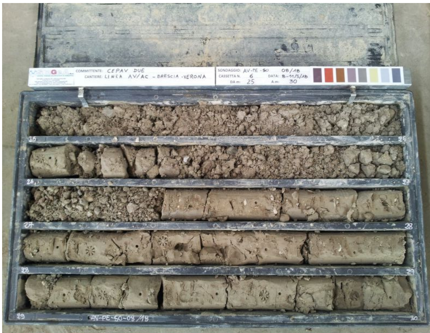
SONDAGGIO AV-PE-SO-08/18 – Cassa n.6 da 25.00 m a 30.00 m