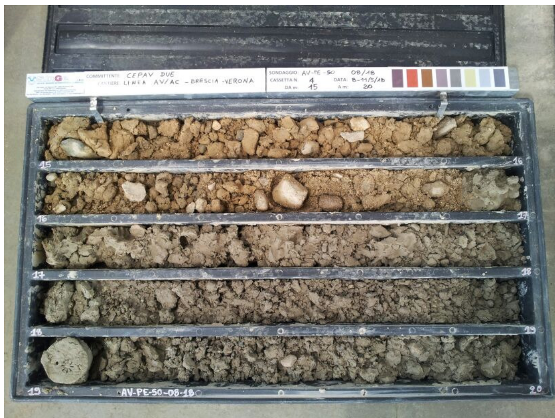
SONDAGGIO AV-PE-SO-08/18 – Cassa n.4 da 15.00 m a 20.00 m