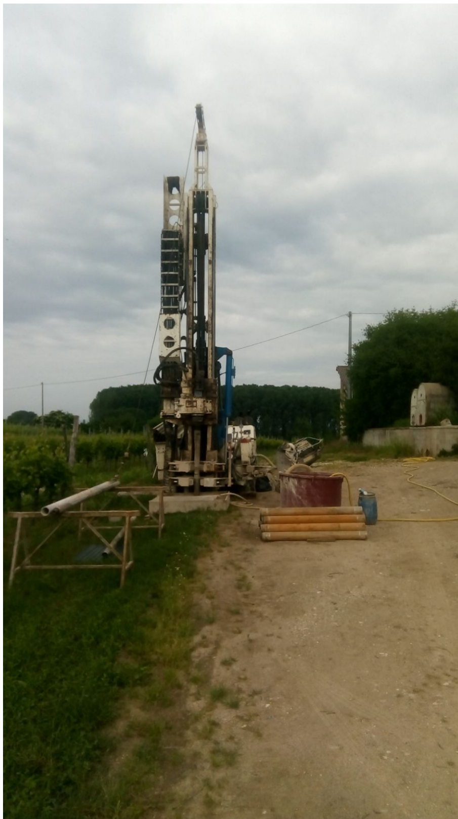
SONDAGGIO AV-PE-SO-08/18 – Postazione