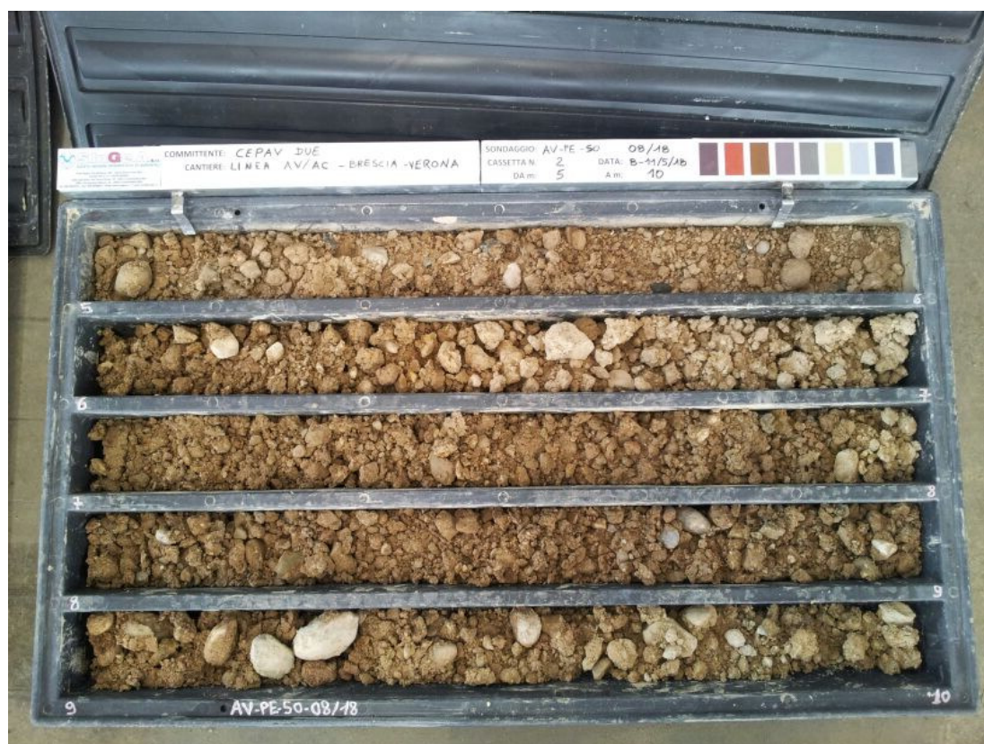
SONDAGGIO AV-PE-SO-08/18 – Cassa n.2 da 5.00 m a 10.00 m