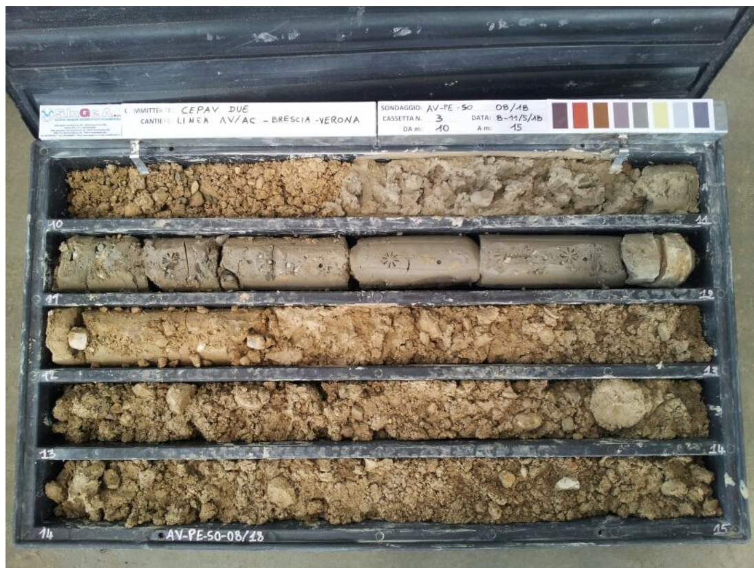
SONDAGGIO AV-PE-SO-08/18 – Cassa n.3 da 10.00 m a 15.00 m