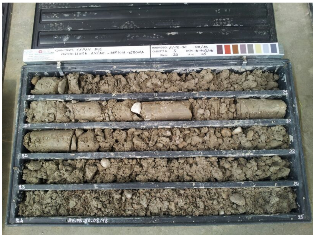
SONDAGGIO AV-PE-SO-08/18 – Cassa n.5 da 20.00 m a 25.00 m